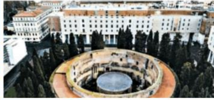
Hotellerie A destra il W in via Liguria, sopra il Bulgari Hotel, a destra il Six Senses in via del Corso e un rendering di Romeo Roma di via Ripetta